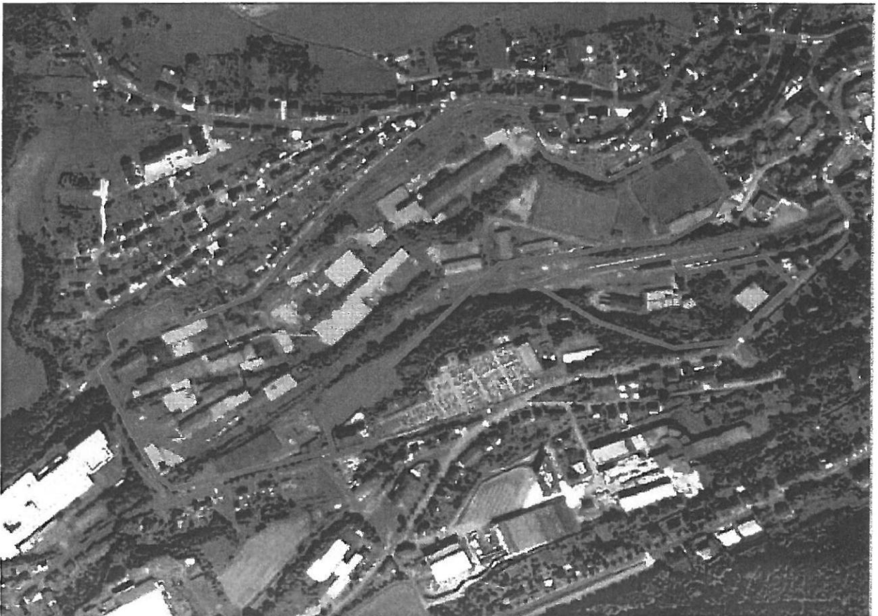
Plan du site

Enfin, celui-ci débouchera sur un masterplan et une ébauche de projet d'aménagement particulier permettant de disposer d'une vision d'aménagement et d'organisation à long terme et de s'assurer de la pertinence économique du développement et de la programmation à mettre en oeuvre pour répondre aux besoins de polarisation de la Ville de Wiltz.