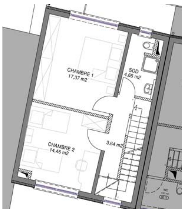
2 e étage