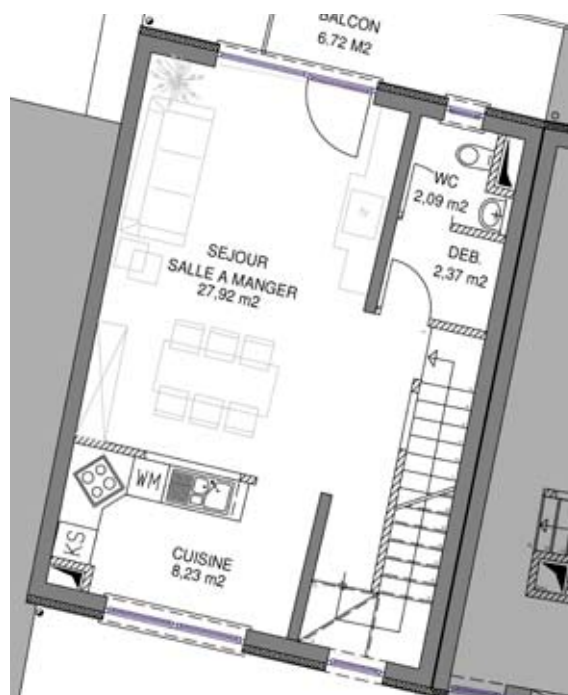
1 er étage