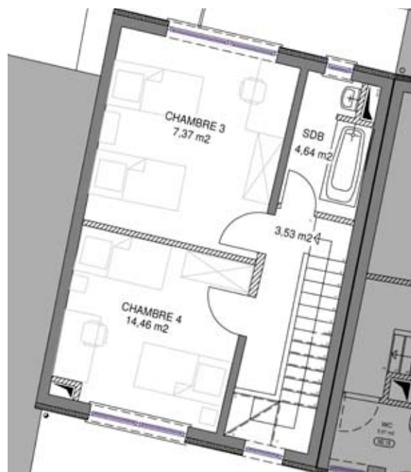
3 e étage