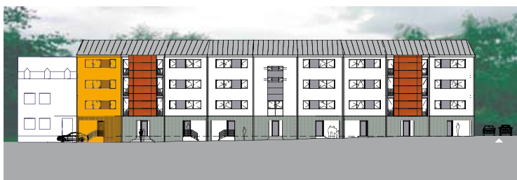
Façade avant (rue de Neudorf)